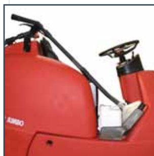
WASHING-DRYING DEVICE NASS-UND TROCKEN-EINRICHTUNG SEPARATE REINIGUNGSSLANG