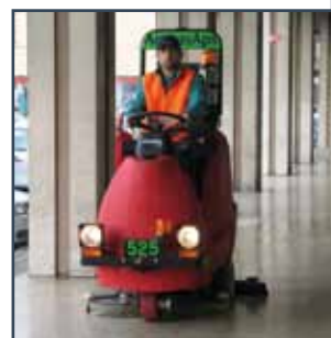
APPROVED FOR ROAD USE STRASSENVERKEHRZULASSUNG GEHOMOLOGEERD VOOR DE OPENBARE WEG