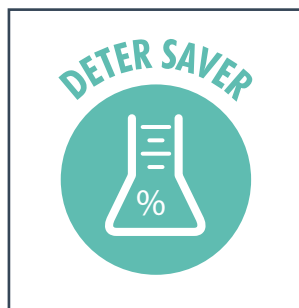
DETER SAVER DETER SAVER DOSEERSYSTEEM