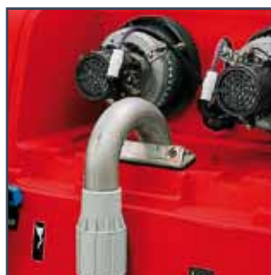
DOUBLE VACUUM MOTOR DOPPELTER SAUGMOTOR DUBBELE ZUIGMOTOR